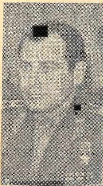
На снимках: космонавт Г. С. Титов дает автографы: на другом — Г. С. Титов.