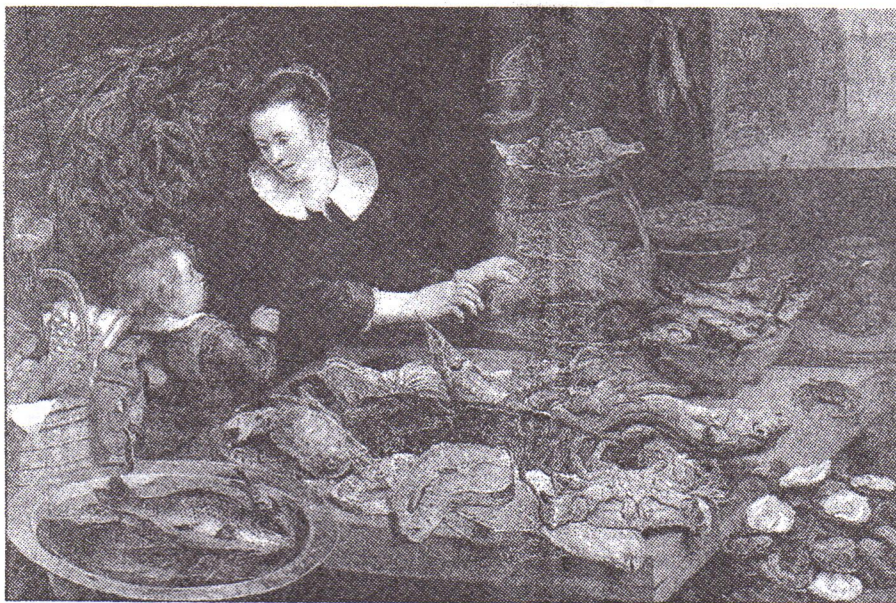
Франс Снейдерс. Рыбная лавка. Ок. 1616-1618. Холст, масло

В общем, много всего удалось увидеть на замечательной выставке. В заключение, хочу отметить, что, по-моему, правительству Москвы необходимо срочно решать вопрос о строительстве или передаче ГМИИ новых выставочных помещений. Шедевры такого класса, как картины фламандских мастеров не должны пылиться в запасниках. Представлялось бы целесообразной и организация передвижных выставок по городам России. Это был бы реальный вклад столицы в культурное развитие широкого круга людей, интересующихся хорошей живописью.