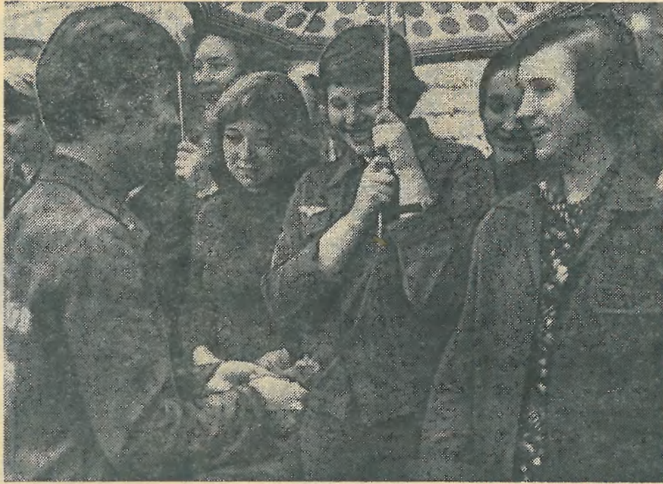
Скоро в дорогу (лето 1977 г.)

Вузовский штаб ССО примет все меры для того, чтобы тре-