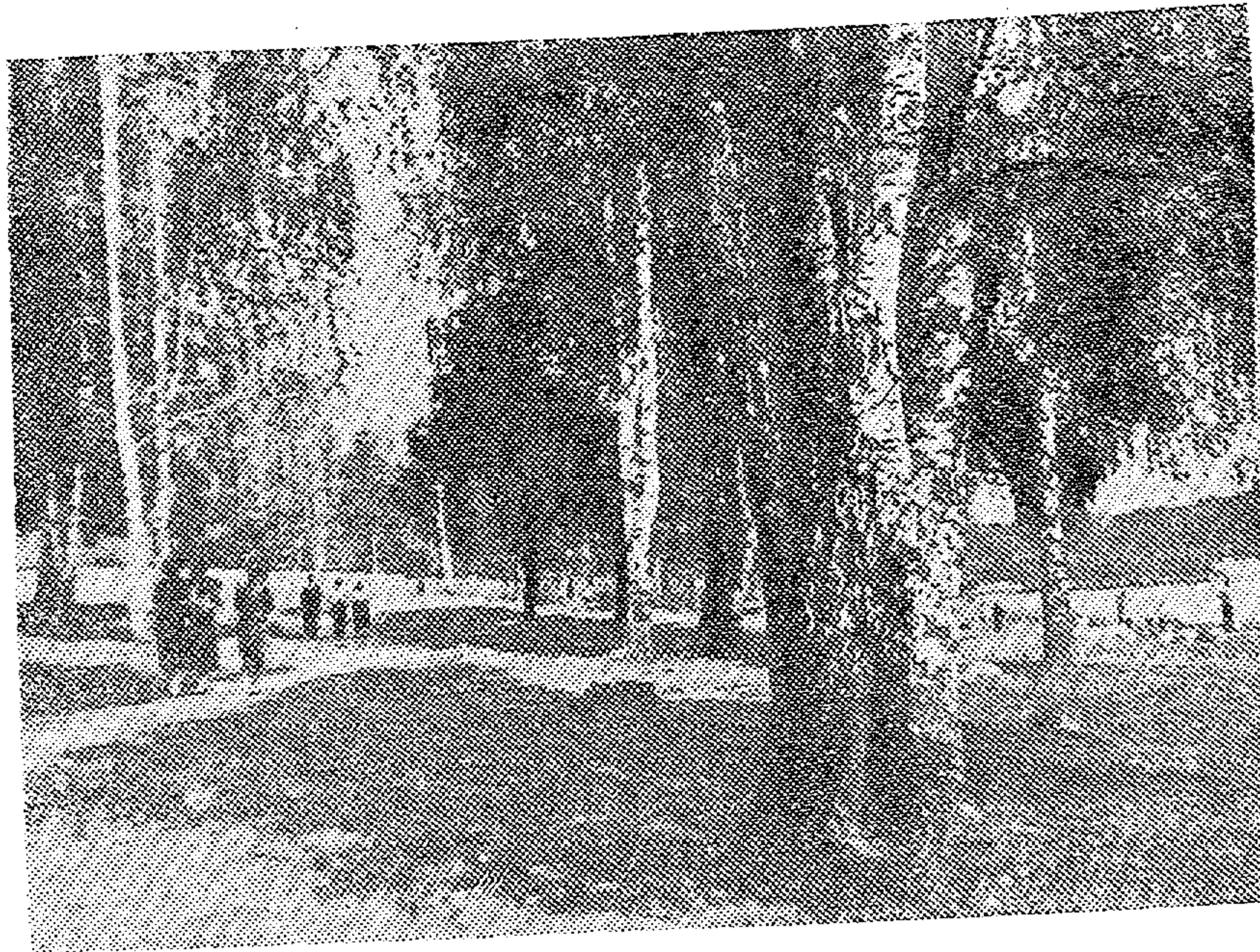
В выходной день в Малаховке.