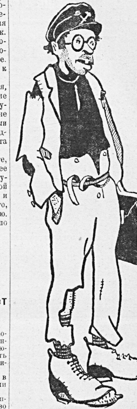
— А я принципиально не согласен.

ДОЛОЙ МОЛОТНИ! Всесоюзный съезд инженеров и техников и открытое общесоюзное партийное собрание Менделеевского Ин-та установили снять формуленную студенческую фуражку.