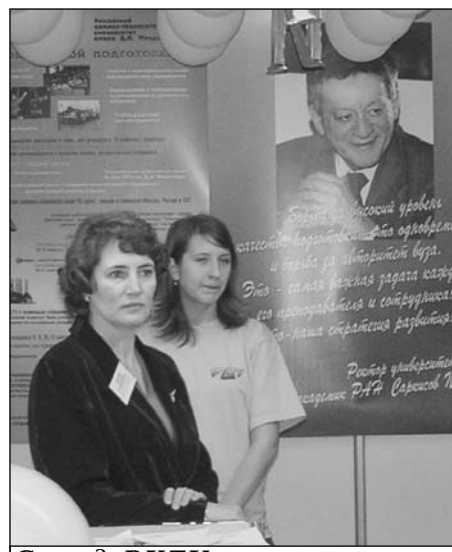
Стенд РХТУ на выставке не пустовал