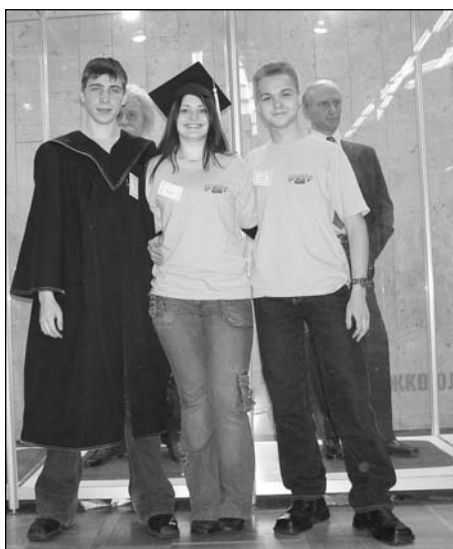
Хорошая компания, не правда ли

Менделеевский университет принял участие в 20-й Международной выставке "Образование и карьера", которая проходила 2-5 декабря в Центральном доме художника. В дни выставки