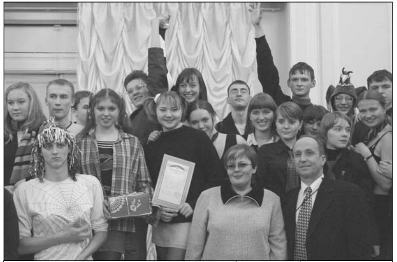
Призы, подарки, фотография на память

Также многие заметили, что КВН в этот раз не блистал особенными юмористическими находками. Были прекрасные выступления (никого из зрителей не оставил равнодушным танец липутов, команды "Поберегись!"), остающиеся в памяти образы (тут, бесспор-