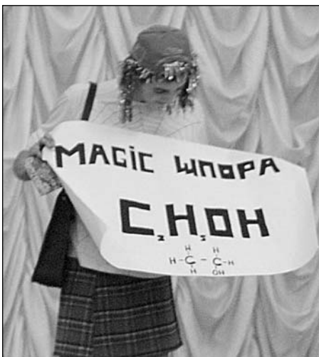
Вот такую бышпоруда на экзамен...

вых двух команд, лица социологов, наконец, озарились улыбками, и у многих появилась мысль, что победа будет легкой. К сожалению, как верно было кем-то подмечено, "все решено за меня". В этом году педагогическое