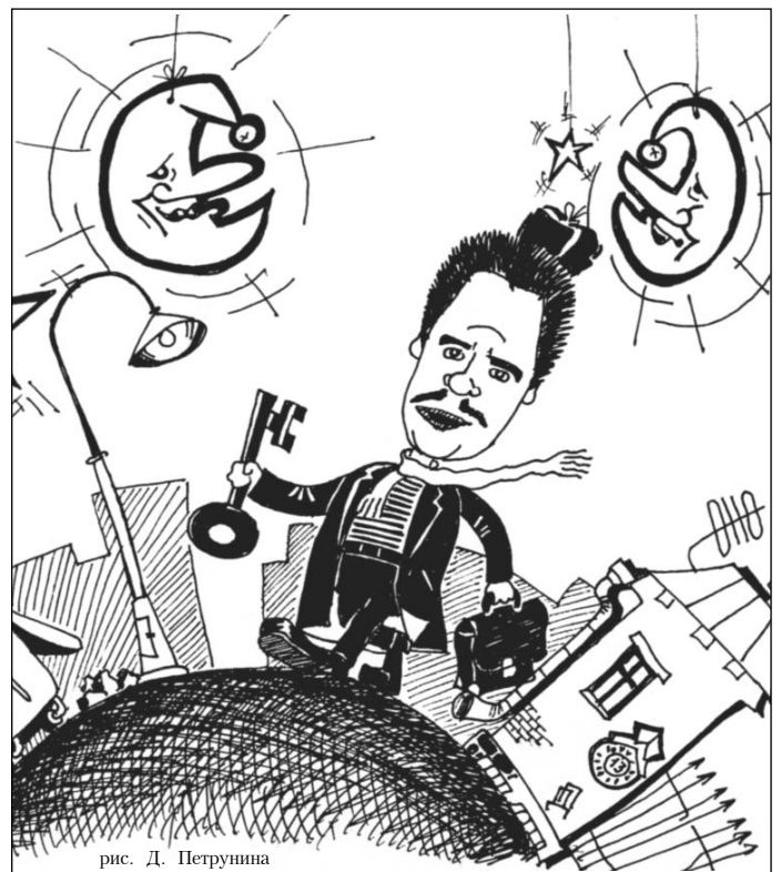
рис. Д. Петрунина

У-у-у!.. Вот так я вою на луну! А в такую ночь не на одну... Эх, потому что в небе две луны И огромные, как валуны!..