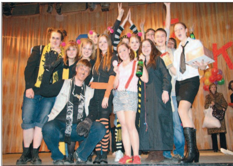
Команда ХТП факультета празднует победу.

братству вполне соответствовал моменту. Приз-"Голосающий Первачок".